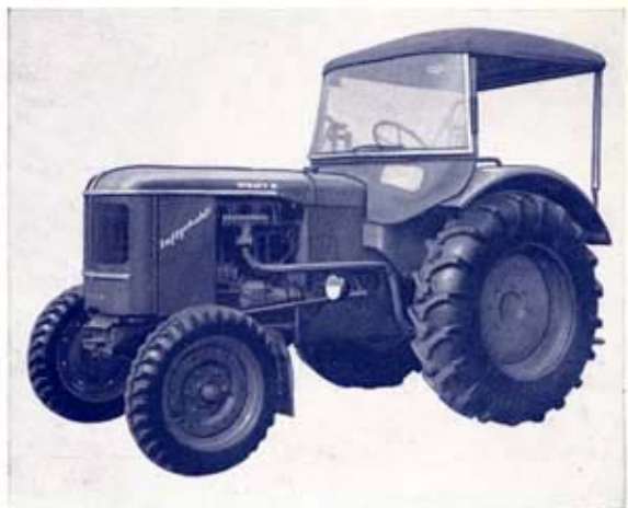
Gefedertes Wetterdach mit Panorama-Windschutzscheibe